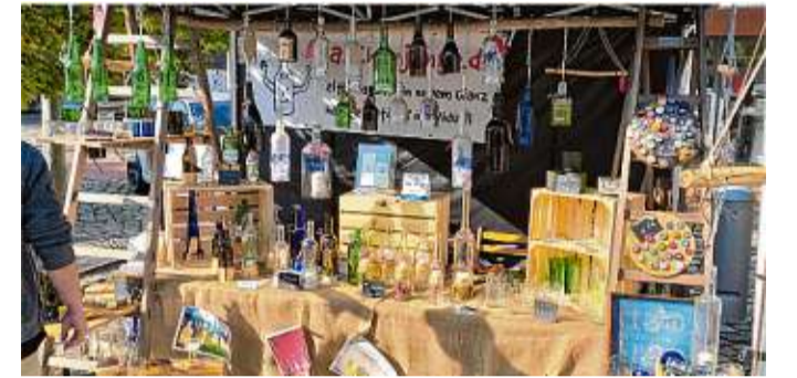
Der Kunst- und Handwerkermarkt

chern. Auch die Pflanzentauschbörse von der Initiative „Blühendes Woltersdorf“ wird wieder dabei sein und lädt ein zum Tauschen von Pflanzen, Stauden und insektenfreundlichen Setzlingen. Das Kulturhaus öffnet die Türen für das Marktcafé mit selbstgebackenem Kuchen, Crêpes und frischem Kaffee. Kalte Getränke und ein herzhafter Imbiss werden ebenfalls angeboten. Lassen Sie sich überraschen und kommen Sie vorbei zum Bummeln, Stöbern, Mitmachen oder Kaufen.